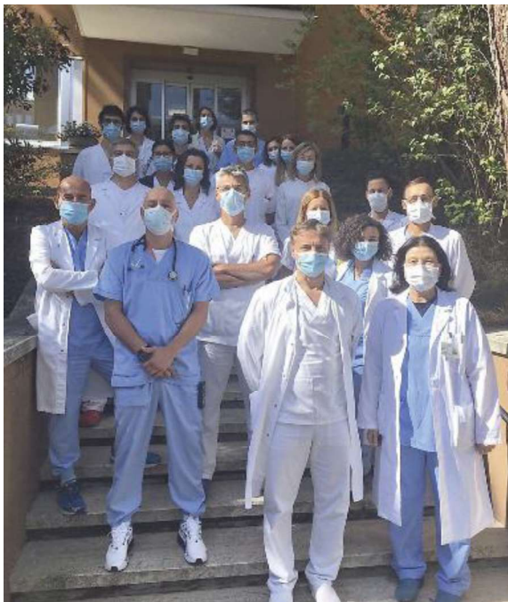
Lo 'stroke team' che coinvolge diverse unità operative dell'ospedale Bufalini

L'ospedale Bufalini di Cesena ottiene il più elevato riconoscimento europeo nella cura dell'ictus cerebrale con l'accreditamento di centro 'Diamante'. È in Italia il primo centro Hub, ovvero un centro a elevata complessità di cura per l'ictus, ad ottenere l'ESO-Angels Award Diamond. Ne dà notizia l'Ausl Romagna. Il progetto europeo Angels, a cui l'Ausl Romagna partecipa dal primo trimestre 2020 viene effettuato presso le Stroke Unit aziendali. Tale progetto, patrocinato dalla Società europea per lo stroke (Eso) e da quella italiana (Iso) oltre che dall'associazione dei pazienti Alice (Associazione per la Lotta all'Ictus Cerebrale) ha come obiettivo la «formazione degli operatori per migliorare il trattamento dell'ictus, costruendo un percorso condiviso che sia il più virtuoso possibile e che consenta di ridurre i ritardi negli intervalli tra il tempo di arrivo in ospedale e la fase di terapia e ricovero». L'iniziativa ha già coinvolto più