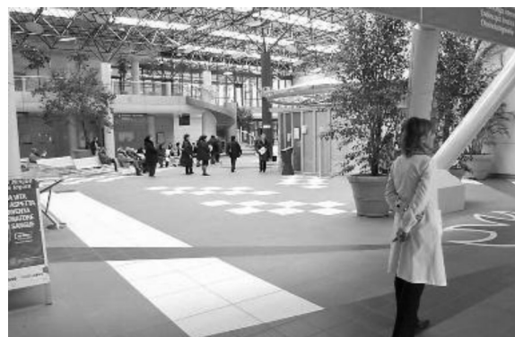
L'androne dell'ospedale Morgagni-Pierantoni di Vecchiavazzo

Nell'elenco dei migliori ospedali italiani, oltre al Policlinico di Sant'Orsola di Bologna e all'Irccs Arcispedale Santa Ma-