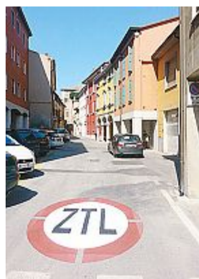
Centro storico Nuove regole d'accesso