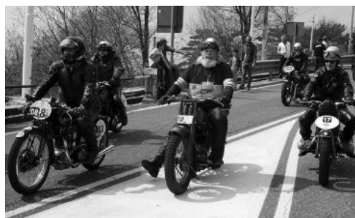
Niente passerella al Fumaiolo per le moto storiche

In tempi recenti in riviera si sono visti operatori turistici "accarezzati" da micro multe dopo aver organizzato aperitivi di gen-