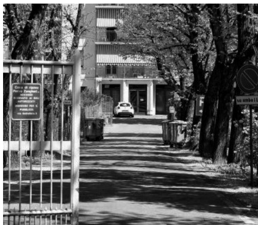
La casa di riposo "Pietro Zangheri" di Forlì

manali e la presenza di almeno 4 giorni a settimana per coordinarne le azioni e migliorare l'organizzazione dei processi sanitari e delle prestazioni erogate. Insomma, per elevare la qualità assistenziale» Il suo compenso è