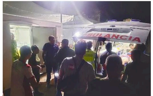
I soccorsi dell'equipe italiana ai cittadini venezuelani colpiti dal terremoto