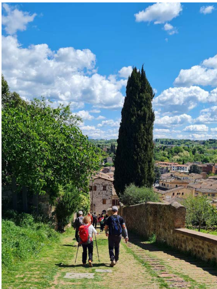
Il trekking lungo la via Francigena da San Gimignano a Monteriggioni proposto lo scorso anno

Confermate le passeggiate nei luoghi tradizionali: La Verna, Ridracoli, eremo di Camaldoli, Fumaiolo e San Vicinio. Ma con «una visione a trecentosessantagradi - specifica Comandini -. Il programma tocca molti aspetti e stimola diverse specificità e attitudini. Andiamo ad accogliere tutti: il camminatore abituale potrà cimentarsi in percorsi più complessi come la Strada delle 52 Gallerie tra Veneto e Trentino o le salite dei passi dolomiti; il neofita potrà godersi lo spettacolo naturale del Delta del Po alla Sacca degli Scardovari e del Lago di Bolsena. Oppure perdersi nella bellezza dell'arte: i borghi