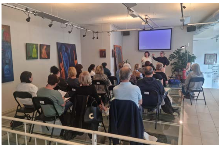
Una precedente edizione del corso per assistenti familiari

Il corso ha una durata di circa 30 ore con una lezione settimanale in aula. Sono previsti complessivamente 7 incontri con esperti dell'area socio sanitaria e un'autoformazione online sul sito re-