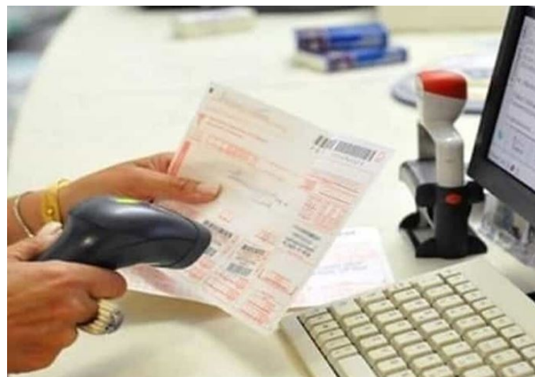
Dal 2 maggio via alla riforma regionale sui ticket

1,65 MILIONI I CITTADINI NON TOCCATI DALLA RIFORMA