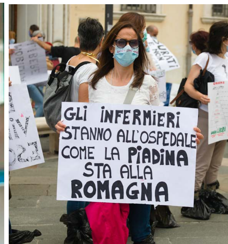
A sinistra infermiere in un reparto. Sopra una manifestazione di infermieri a Ravenna nel 2020 in pieno periodo Covid

spende anche più del doppio in sanità pubblica».