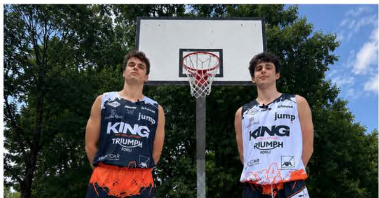
Serate di basket al Polisportivo "Monti"

Non solo palla a spicchi ma anche musica, street food e cocktail bar Si comincia questa sera