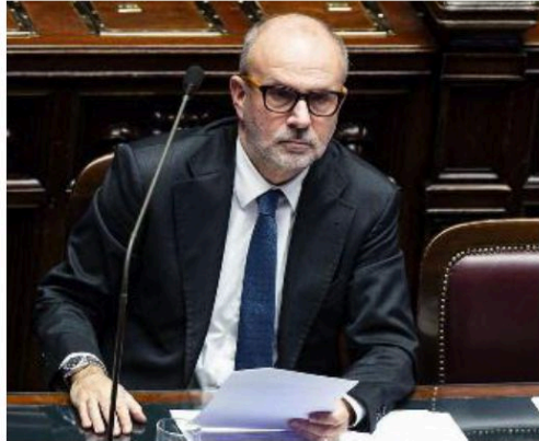
Orazio Schillaci, 58 anni, ministro della Salute