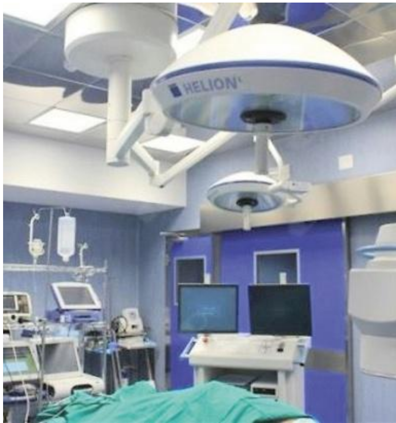
AVANGUARDIA La nuova apparecchiatura 'Navex' di Cesena

I MEDICI non hanno tardato ad individuare la patologia: non si trattava di un semplice malore, ma di tachicardia parossistica sopraventricolare. Ovvero un'anomalia che provoca svenimenti e accelerazione del ritmo cardiaco,