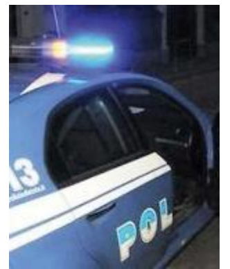
INTERVENTO Sul posto le forze dell'ordine hanno catturato il malvivente