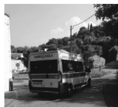
Un'ambulanza in uscita dal Ps

In questi giorni il Comune sarà chiamato ad affrontare i problemi dell'emergenza-urgenza in consiglio comunale. Una specifica interpellanza è stata depositata in queste ore da Cesena Siamo Noi. Le vicende che hanno indebolito "numericamente" in zona il servizio ambulanze del 118 sono state più volte esplicitate dal Corriere in questi mesi. Prima un cambio di legge che ha costretto a coprire la mancanza di reperibili per i trasferimenti da Bagno di Romagna. Poi il "provvisorio" ma ancora attivo carico i servizi per gli spostamenti delle termocule dal Bufalini verso le altre neonatologie della Romagna. In ultimo il taglio dei fondi per il personale fuori servizio che si prestava per i trasporti in ambulanza di trasferimento verso tutti gli ospedali del centro nord