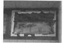
La finestra rotta

Per entrare nella struttura hanno sfondato una finestra sul retro