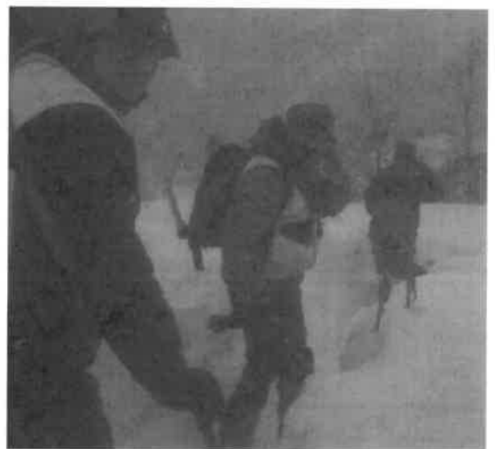
Sopra, alcuni degli uomini impegnati nell'esercitazione in mezzo alla neve. A fianco, un mezzo del Soccorso alpino in una situazione invernale