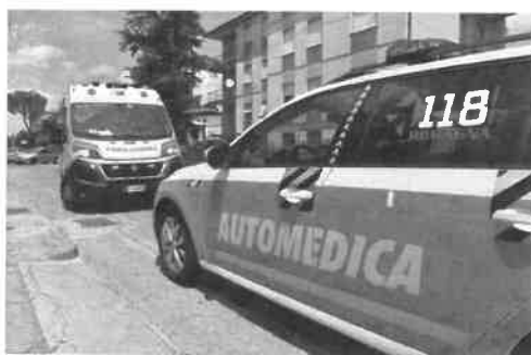
Continua a far discutere il taglio dell'automedica da Meldola

stati davvero molto bravi e professionali, le hanno fatto alte dosi di steroidi, adrenalina e cortisone, con parziale risoluzione dei sintomi. Il medico ha detto che doveva andare a Forlì, però proprio per i sintomi avuti, ha voluto chiamare l'ambulanza col medico a bordo. L'auto però era fuori per un altro soccorso. A quel punto è stata chiamata la seconda Mike da Cesena. Sono arrivati alle 15.35 e ripartiti alle 15.41, non so esattamente quando è stata chiamata dal presidio, saranno passati 50 minuti e poi parliamo di un presidio ospedaliero, pensiamo se fosse capitato in Campigna o a Corniolo. Intanto i medici le hanno fatto radiografie e prelievi in attesa dell'arrivo per non perdere tempo. L'ingresso al pronto soccorso di Forlì è stato alle 16.34