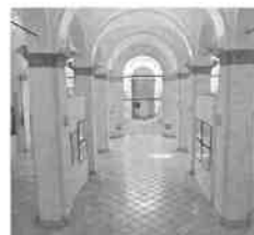
La Galleria Pescheria