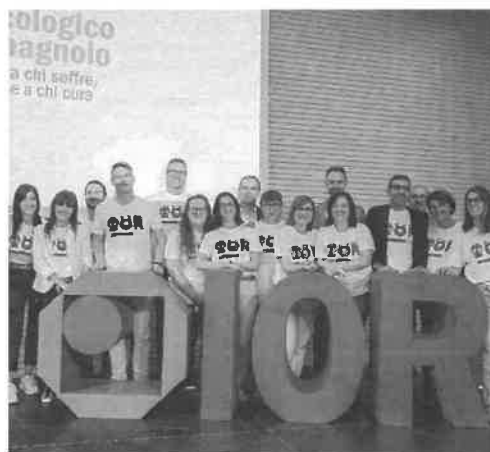
Volontari dello Ior