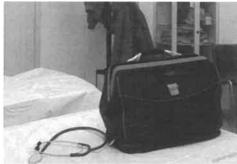
Le guardie mediche saranno aggregate nel Cau

dell'Ausl e per l'istituzione dei Cau. Un'operazione, già iniziata a Forlì nell'agosto scorso, e che verrà attuata gradualmente. «La riorganizzazione verrà messa in campo con la più ampia partecipazione di tutte le rappresentanze professionali, anche tramite il coinvolgimento all'interno di specifici gruppi di lavoro tematici - si spiega nella nota -. In questo senso si segnala che è stata formalmente richiesta, esollecitata, la partecipazione ai gruppi di lavoro anche da parte dei medici convenzionati della medicina generale e continuità assistenziale per consentire un loro contributo concreto allo sviluppo dei servizi. Tale richiesta non ha, ad oggi, ancora avuto riscontro, né sono pervenute alla direzione generale proposte volte a migliorare il servizio reso alla cittadinanza». Per concludere: «L'investimento in atto sul territorio della Romagna vede l'individuazione di una vera e propria rete di servizi e professionisti, integrati tra loro e coordinati con la centrale unica che, a regime ed in connes-