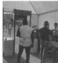
I controlli Securitaly