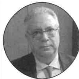
Antonio Magi Presidente dell'Omceo

«Ogni anno vengono intentate contro i medici 350mila cause penali, il 97% si conclude in un nulla di fatto ma si crea comunque un danno enorme alle casse dello Stato, oltre a un condizionamento del comportamento dei colleghi. Il problema esiste e i numeri sono questi, che portano oggi a risarcimenti a carico dello Stato pari a 3 miliardi e 700 milioni di euro, quando nel 2014 erano di 2 miliardi e 400 milioni. E il tema esiste anche livello privato, dove la stima è di 400 milioni»