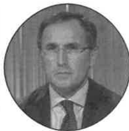
Francesco Boccia Capogruppo Pd al Senato

«Sulle pensioni dei medici come sulla sanità il governo sta sbagliando tutto, ha deciso di tornare indietro e di diminuire lo stanziamento in rapporto al Pil, che con Speranza aveva toccato il 7%. Il Pnrr era stato approvato anche per sostenere il Ssn, che si era mostrato fragile soprattutto nelle regioni del Nord dove la Destra aveva privatizzato di più. Se ti accorgi che i medici che stanno andando in pensione ora prenderanno di più di quelli che lo faranno tra 20 anni, non abbassi le pensioni degli attuali dottori, alzi quelle dei giovani»