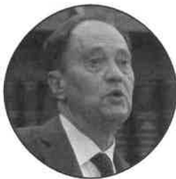
Luca Ciriani Ministro Rapporti con il Parlamento

«Contiamo che il governo possa depositare i suoi emendamenti» alla manovra «entro questa settimana». Lo ha detto il ministro per i rapporti con il Parlamento Luca Ciriani al termine della riunione con maggioranza e opposizione, precisando che «il più importante è quello sulle pensioni dei medici: ne ho appena parlato con Giorgetti (ministro dell'Economia, ndr), ci stanno ancora lavorando, speriamo che in tempi rapidi sia pronto».