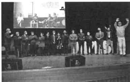
Il palco dell'assemblea dei soci Avis al teatro Diego Fabbri