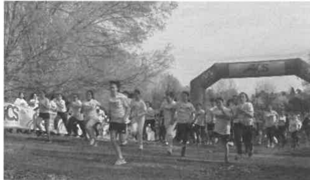
Una delle partenze delle varie corse disputate ieri al Parco urbano e, sotto, tutti gli alunni saliti sul podio nelle sei categorie in cui era divisa la manifestazione